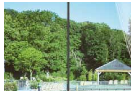
Prestige 70 Exterior