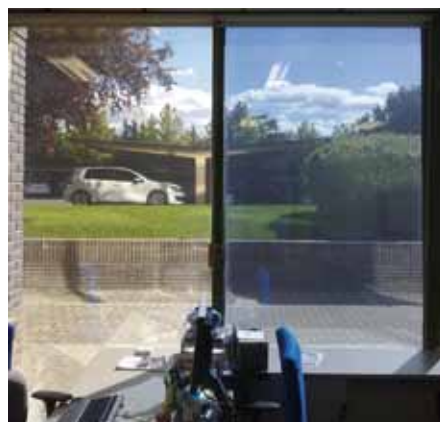
Prestige 40 Exterior compared with a metallized silver film