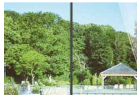
Prestige 90 Exterior